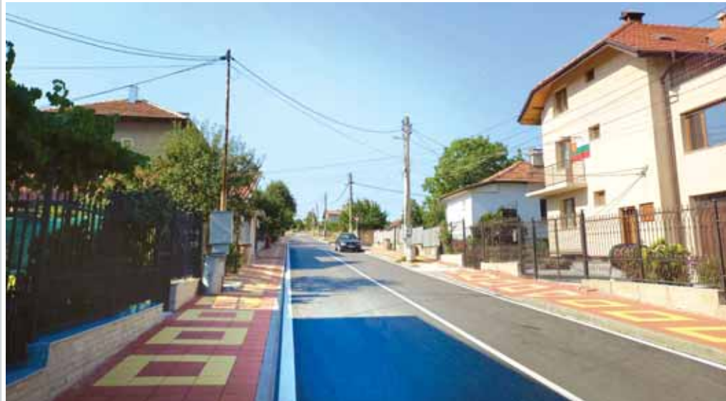
Общинската инфраструктура – един от основните приоритети!