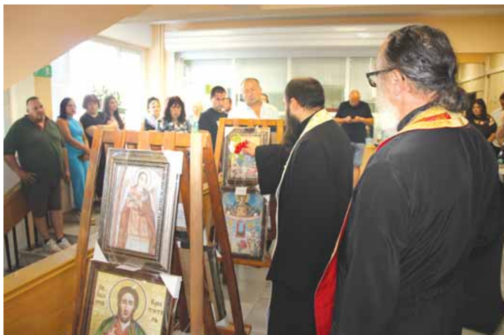
Проведе се благотворителния търг на икони за иконостаса в храма „Св. Възнесение Господне“ – на стр. 3