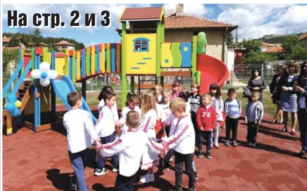
Децата – приоритет и грижа на община Драгоман!