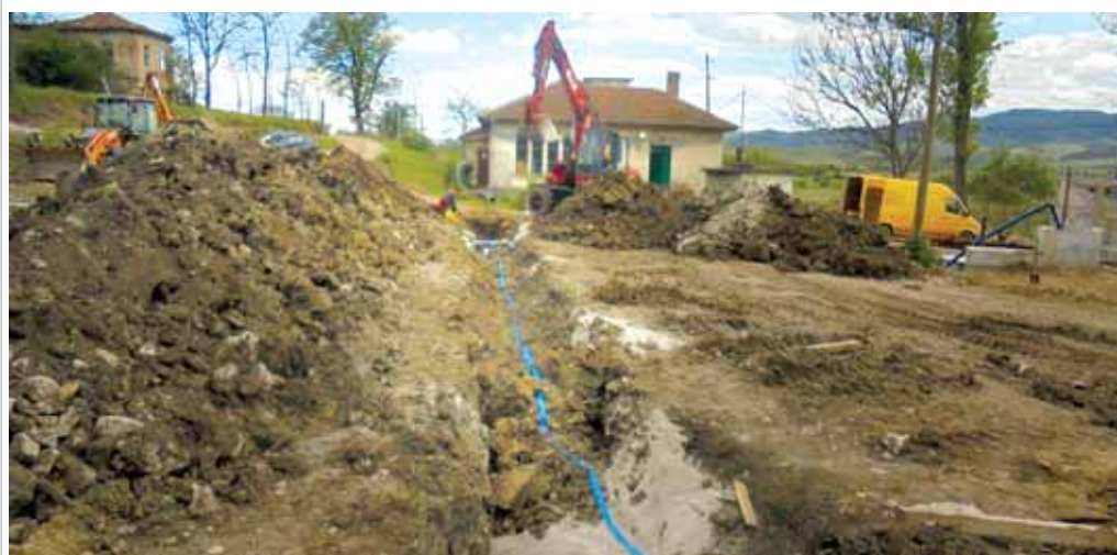
Водоподаването на общината – дългият път към успеха!