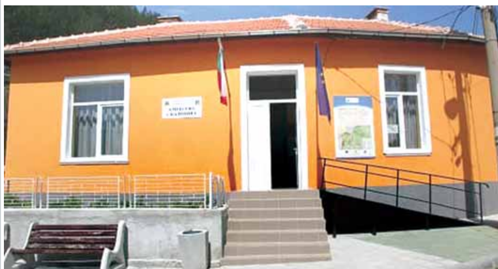
Реновирани сгради на Кметствата!