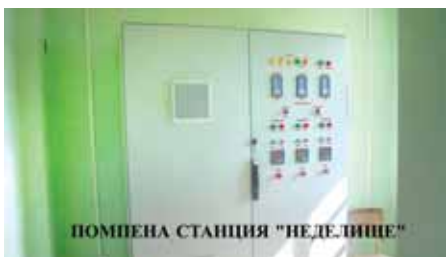
ПОМПЕНА СТАНЦИЯ „НЕДЕЛИЩЕ“

- Нови спирателни кранове в града, за райониране водоподването при аварии във вътрешната ВиК мрежа;