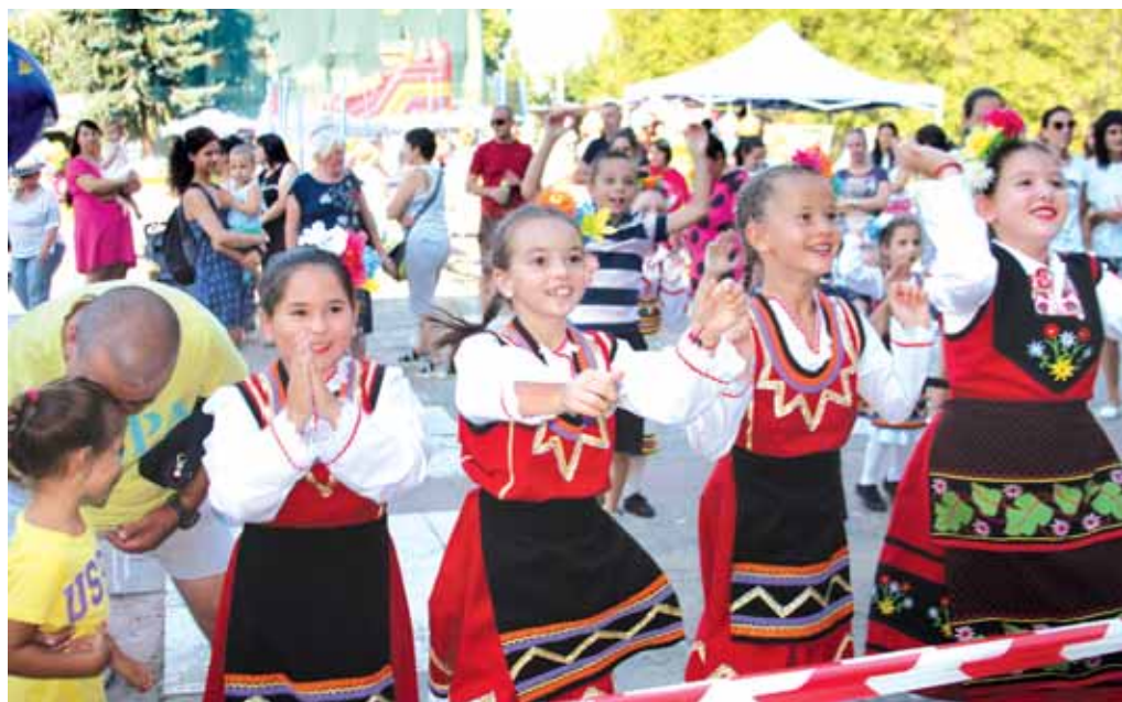
Двудневни тържества за празника на Драгоман! – на стр. 4